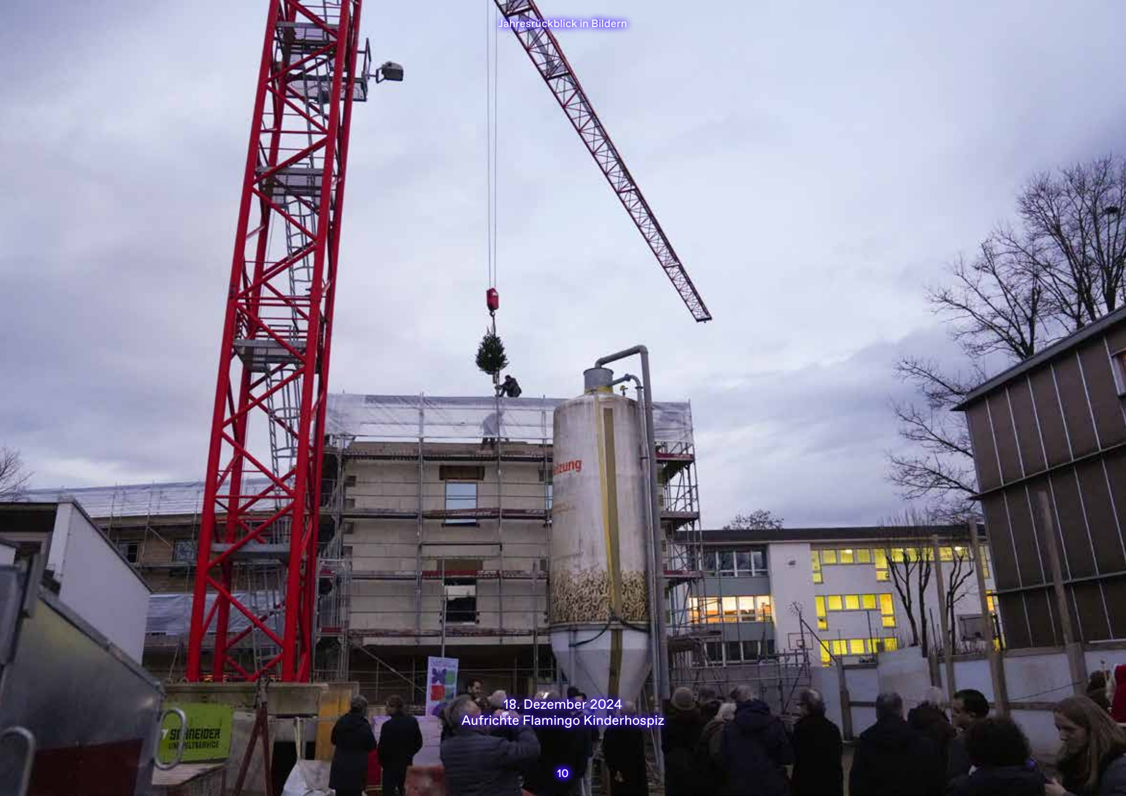
18. Dezember 2024 Aufrichte Flamingo Kinderhospiz